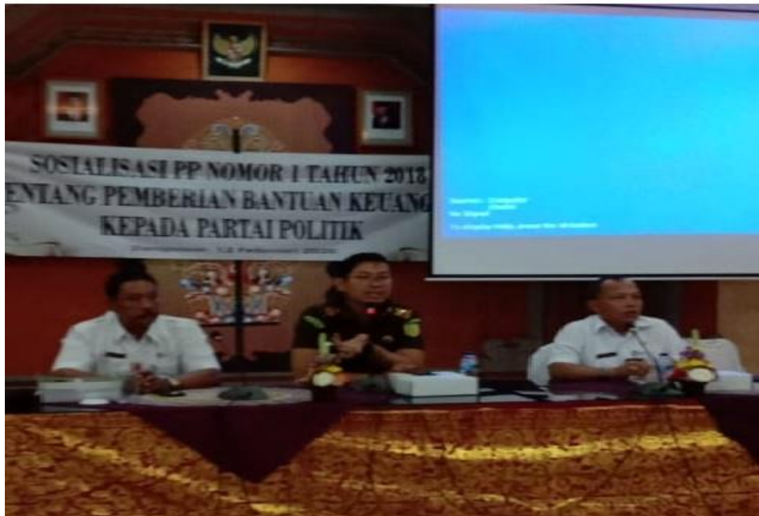
Foto Kegiatan Sosialisasi PP Nomor 1 Tahun 2008 tentang Pemberian Bantuan Keuangan Partai Politik Kota Denpasar yang dilaksanakan Badan Kesbangpol Kota Denpasar Tahun 2020