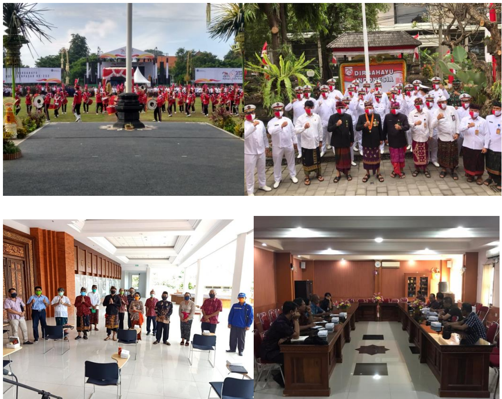
Gambar 3.2 Foto Kegiatan yang dilaksanakan Badan Kesbangpol Kota Denpasar Tahun 2020

Pada indikator persentase menurunnya kasus-kasus SARA terjadi peningkatan capaian realisasi, dari capaian di tahun 2017 adalah sebesar 60% naik menjadi 70% pada tahun 2018, naik menjadi 80% pada tahun 2019, dan mengalami kenaikan menjadi 90% di tahun 2020. Di tengah masa pandemi Covid-19 Badan Kesatuan Bangsa dan Politik telah dapat melaksanakan kegiatan sesuai dengan kinerjanya.